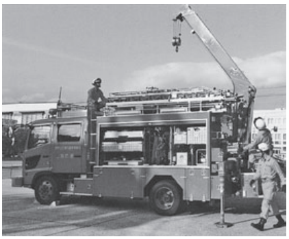
救助工作車での訓練に励む隊員

平成29年 西村山広域行政事務組合の概要と第一回臨時会(5月29日)の内容をお知らせします。