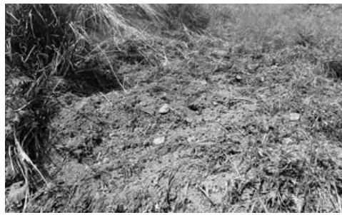
イノシシに掘り起こされたワラビ畑

がら、夏期のくくり罠、箱罠での効率的な捕獲について、検討会や学習会を随時行っています。