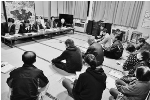
大沼公民館（大沼・大暮山）

平成29年度、第6回議会報告会が4月18日、大谷地区、大沼・大暮山地区を皮切りに8日間、16会場で開催されました。各会場とも出席者の熱心な質疑と意見、要望をいただきありがとうございました。 今後、所管委員会において精査し分類した上で、重要な案件については9月の定例会において「意見書」として町長に提出します。