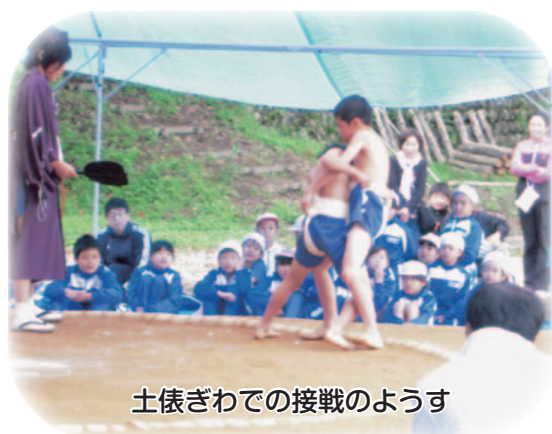
土俵ぎわでの接戦のようす