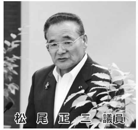
松尾 正二 議員

町長…「しごとサポート連携協議会」 を立ち上げ町全体で連携し、 ワンストップで支援します。