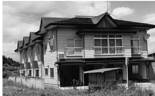
元町地区に整備された新規就農者受け入れ研修宿泊所

町長 新規就農者は、27人おり内7人が新規参加者です。研修を受け入れる協議会の組織化や、農業研修生等の