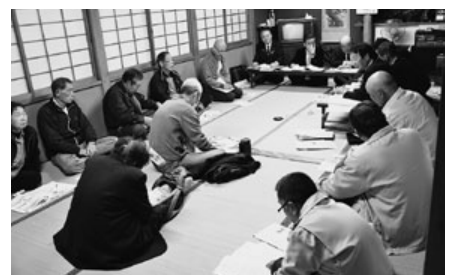
立木公民館（立木・白倉）