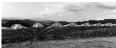
補助対象雨よけハウス

農林振興課長 柏原ぶどう団地（生産者4人）を対象としており、雨よけハウス約0・4ha分で、主力品種シャインマスカット生産への補助です。