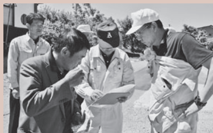
産業厚生常任委員会の現地調査

この請願については、2つの請願内容があり、1つは町道の舗装、1つは和合堰の町道区間の側溝整備の2つであります。 町道部分 については「 採択 」。 和合堰 については、和合地区の水利組合が管理するものであり、農林振興課サイドの補助事業で対応できるものと判断し「 不採択 」としました。