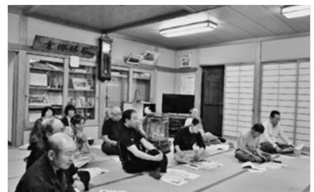
助ノ巻公民館（助ノ巻・雪谷）