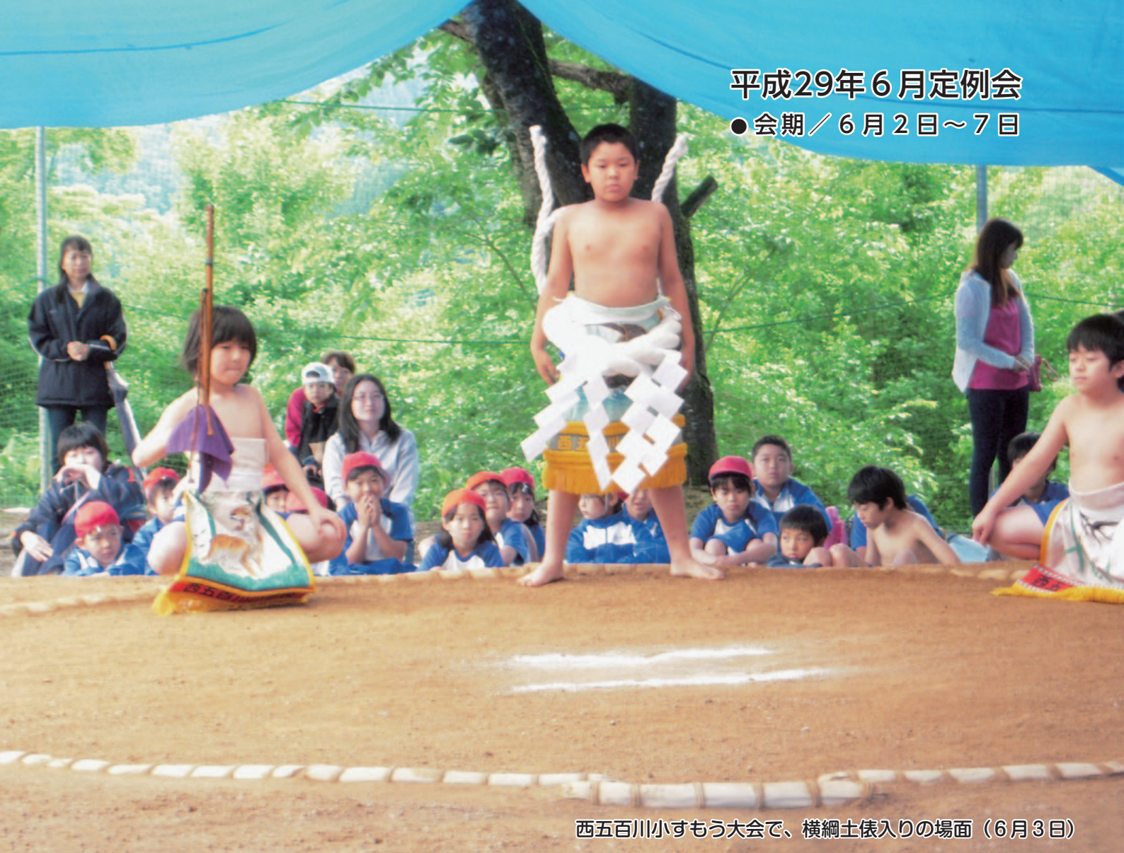
西五百川小すもう大会で、横綱土俵入りの場面（6月3日）