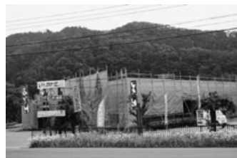
改装中の五百川温泉

町長 高齢者の生きがいと健康づくり、高齢者の活動を行う拠点施設として運営します。