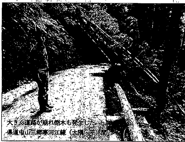
大きな道路が崩れ樹木も発生した。県道中山三郷寒河江線（大隅・合平）