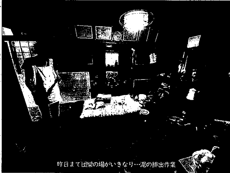
昨日まで団集の場がいきなり…泥の排出作業