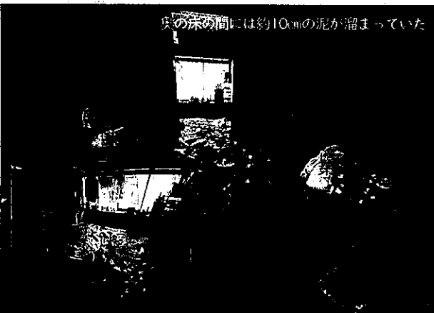
床の間に約10cmの泥が溜まっていた

※この画像は家主さんから「皆さんも災害には気をつけて」との了解を得て載せることにしました。難儀しているなか、ご協力をいただき有り難うございました。