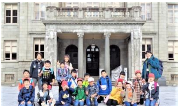
文翔館の前でハイポーズ！（3・4年）