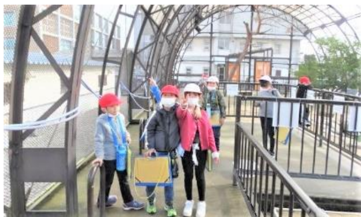
動物園の鳥小屋ゾーンを見学しました（1・2年）