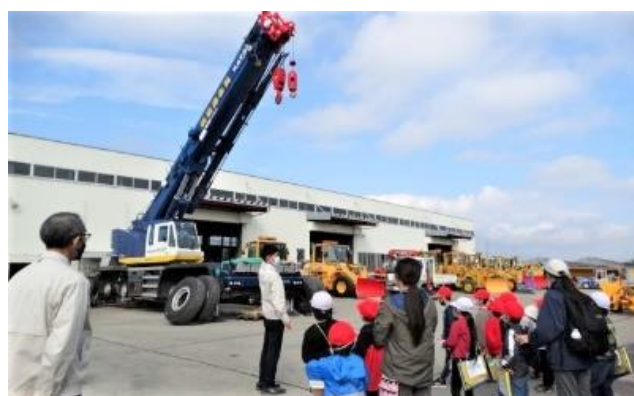
働く車の迫力におどろきました（1・2年）