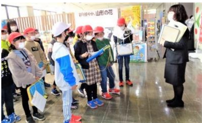
県庁のロビーで説明を聞いています（3・4年）