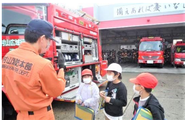
消防車の働きを教してもらいました（1・2年）

3・4年生は霞城セントラル 1 階の山形県観光センター、山形県庁、文翔館、遊学館を見学しました。県庁所在地にある重要な施設を訪れて、それぞれの施設の役割などを学びました。