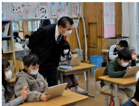
2・3年生のタブレットを使った道徳