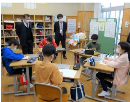
4年生の国語は慣用句の学習