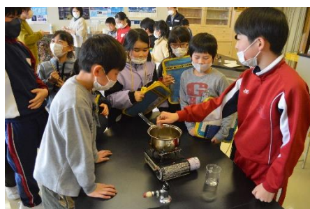
自然・科学クラブはべっこう飴づくり