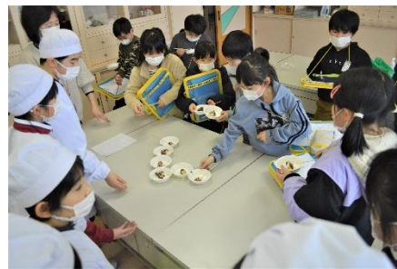
創作クラブは調理実習