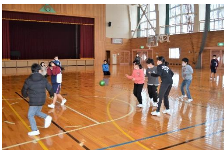
スポーツクラブはドッジボール

大谷小学校では、4年生以上がクラブに所属しています。スポーツクラブ、自然・科学クラブ、創作クラブです。4日は3年生がクラブを見学して、来年度に入りたいクラブの参考にしました。