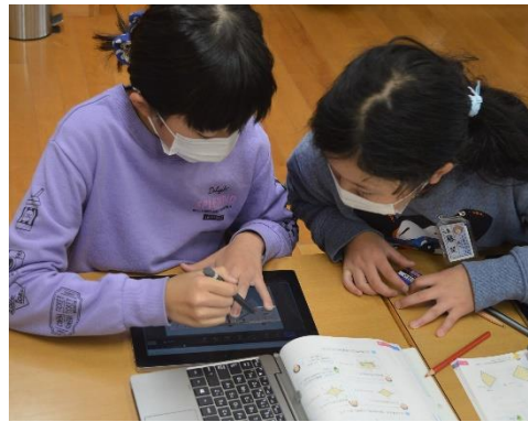
②考えたことをもとに、友達と意見を交流しています。