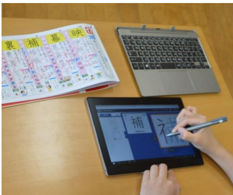
タブレットで漢字の筆順を学んでいます。