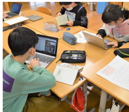
社会科で調べ学習をしています。調べたことをワードでまとめます。