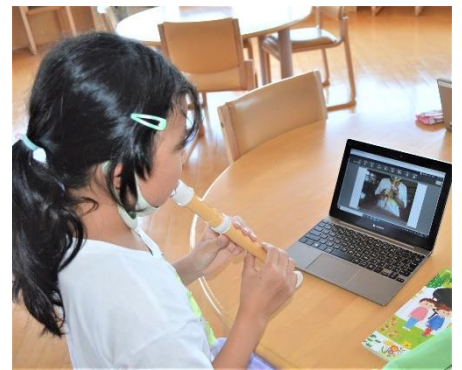
タブレットの録画機能を使ってリコーダーの演奏を録画しています。