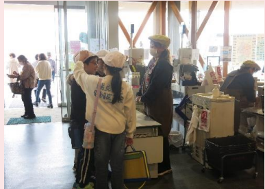
スタッフの方やお客さんにインタビューもしました