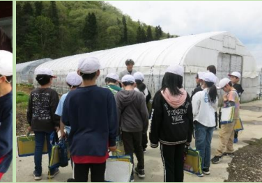
育苗ハウスを見学