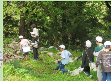
きのこの原木栽培の様子も見学

堀農園で、お米の育苗ハウスや播種機で米の種まきをする様子を見学させていただきました。ご自宅の敷地内で、きのこの栽培もされていました。堀農園では、毎年新しいことにチャレンジされているそうです。