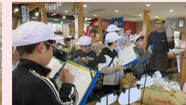
お米コーナーで販売されているお米を観察