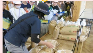
米袋にラベルを貼ってお米コーナーに並べます