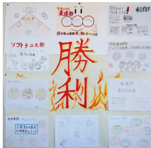
↑2年生の決意 ↓1年生の決意

なお、大会当日に学校協力員として大会会場に入ることのできる保護者の方もおりますが、選手同様に健康観察や検温等をしっかりとした上で、参加くださるようお願いいたします。