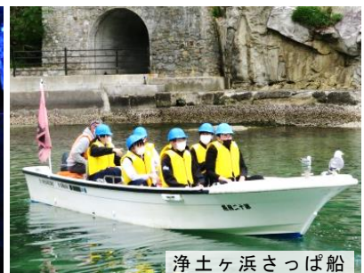
浄土ヶ浜さっぱ船