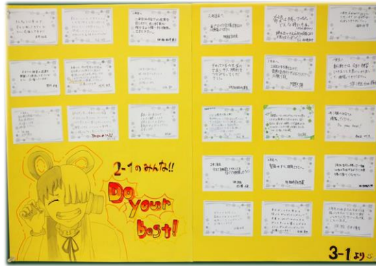
3年生からの応援メッセージ

いよいよ9月24日、25日に西村山中学校新人総合体育大会が予定通り開催されます。この大会は1・2年生の新チームで臨む最初の大きな大会になります。6月の地区中学総体や7月の県中学総体後に、3年生からバトンを託され、暑い中頑張ってきた成果を発揮する場になります。どの部も部員数が少なく、また、コロナ禍ということもあり、たくさんの不安がある中ですが、1・2年生の部員が協力して、ようやくこの大舞台に立つことができます。特に、野球部は陵南中と合同チームを組んでの出場となるため、平日は学校で練習し、週末は陵南中に行き、合同練習や練習試合に取り組んできました。野球部に限らず、どの部も順風満帆でここまで来たわけでなく、いろいろな困難を乗り越えての大会出場ではないかと思えます。だからこそ、この大会に参加できることを感謝し、自分たちが今できることを精一杯やってきてほしいと思います。各会場での、朝日中生の健闘を祈ります。頑張れ朝日中！