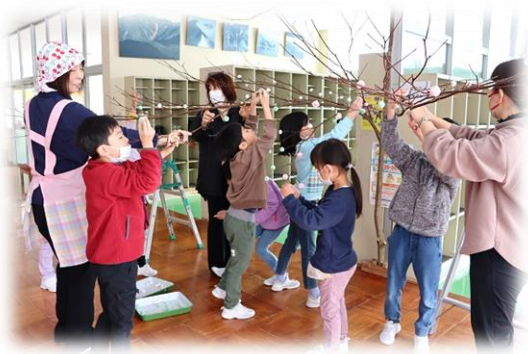
団子さしと団子“ばくだん”（1・2年）