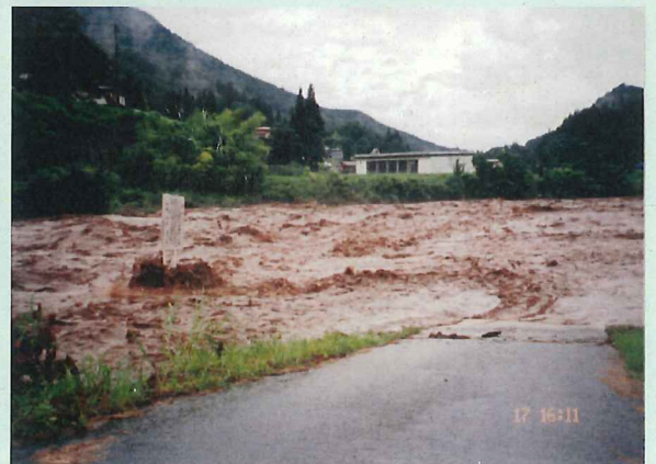
立木河川公園地点(約4m水位上昇)