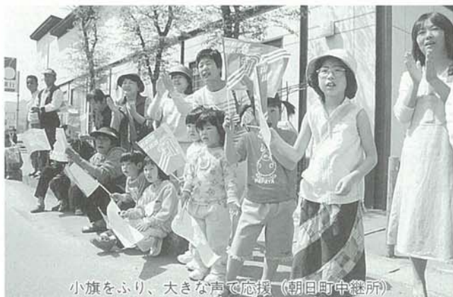
小旗をふり、大きな声で応援（朝日町中継所）