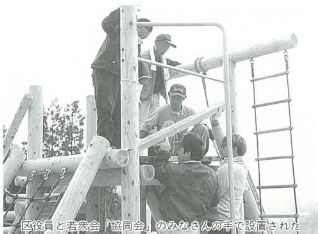
区役員と若衆会「協同会」のみなさんの手で設置された