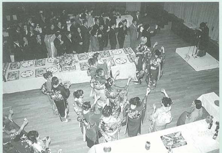
実行委員会主催の祝賀会は開発センターで。 成人を祝い、そして再会を喜び、高らかに「カンパニー」