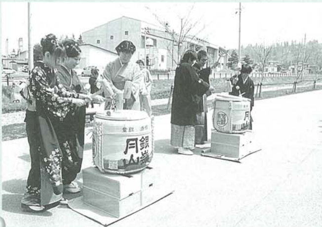
成人を祝い準備された酒樽。 実行委員の手で勢いよく鏡開き