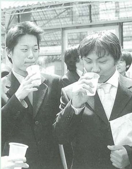
お酒もタバコも20歳から。 辛口日本酒は大人の味？

その後、新成人たちは鏡開きや祝賀会に参加。久しぶりに会う同級生や恩師とグラスを傾け、思い出話に花を咲かせていました。