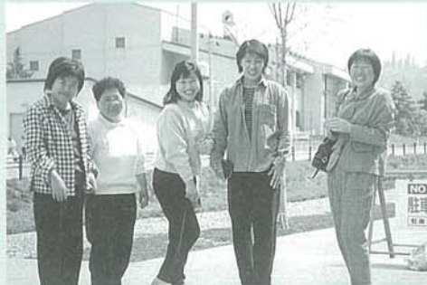
子どもたちの晴れ姿を前に、うれしさいっぱいのお母さん方