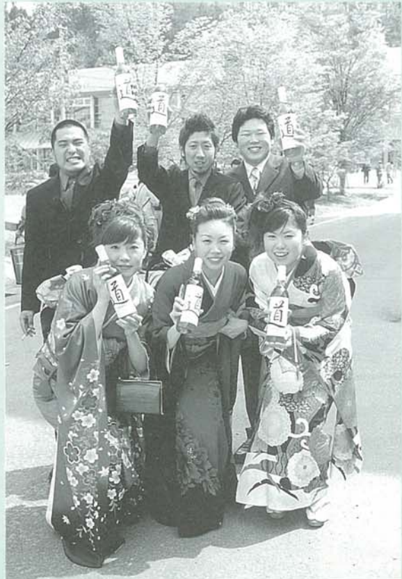
記念品は町特産のワイン。 今年の成人式のテーマ「道」がラベルに 印刷されている