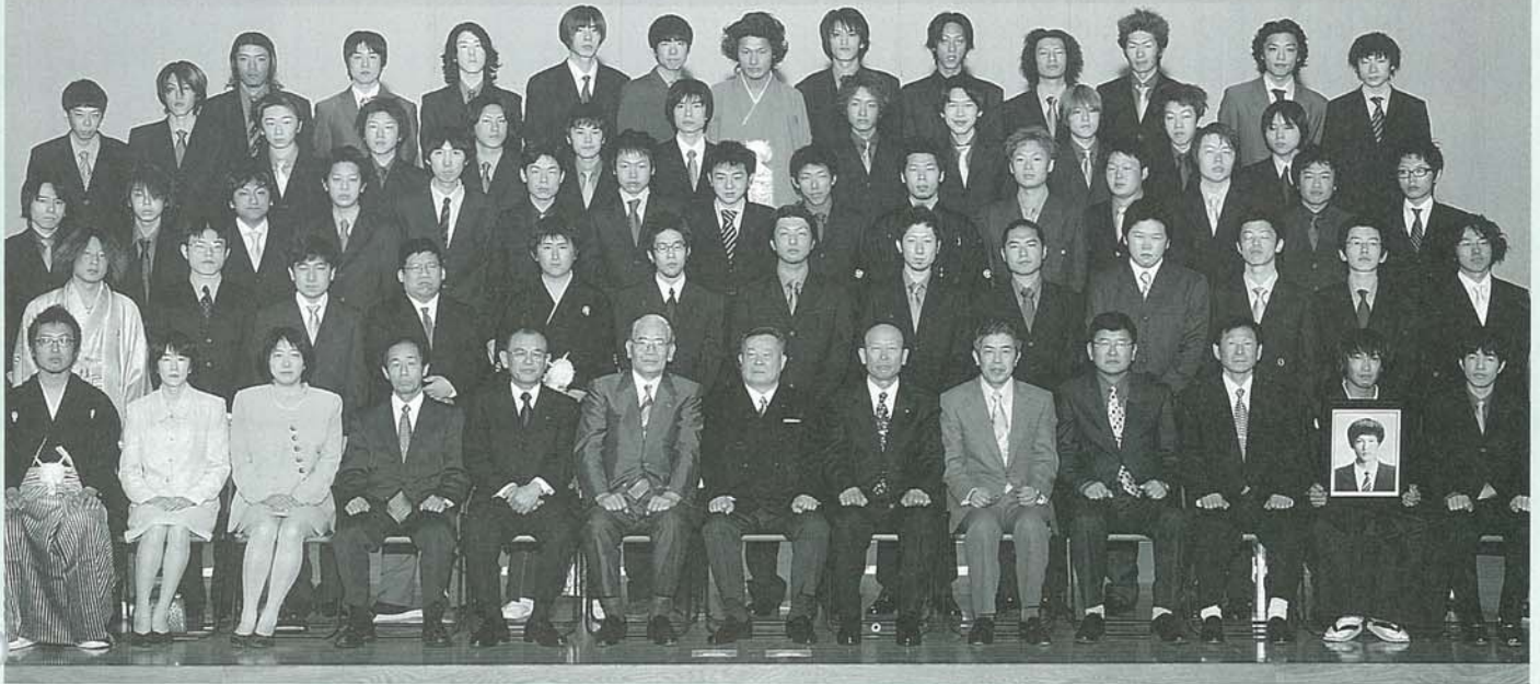
スーツ、羽織り袴でバッチリきめた男性たち