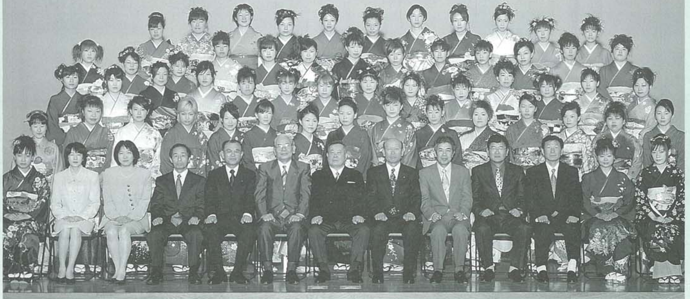
あてやかな着物姿が美しい女性たち