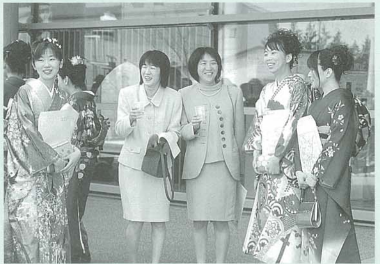
中学卒業から5年。 成長した教え子たちとの再会に先生も笑顔