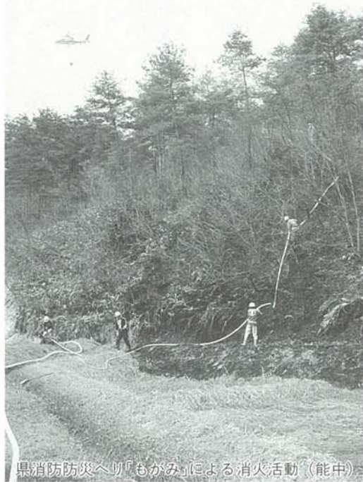
県消防防災ヘリ「もがみ」による消火活動（能中）

農作業や山菜採りで山に入る機会が多くなる季節です。「風の強い日にはたき火はしない」「火のそばには水を用意し、目を離さない」「タバコのポイ捨ては絶対にしない」などの決まり事を守り、防火に努めましょう。