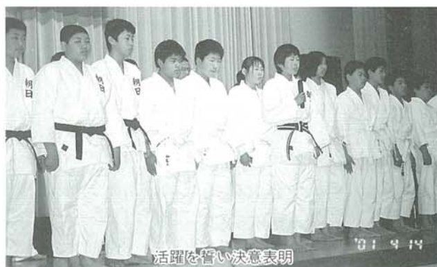
活躍を誓い決意表明