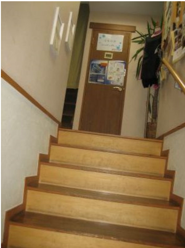
お目当ての2階に向かって階段を昇り…