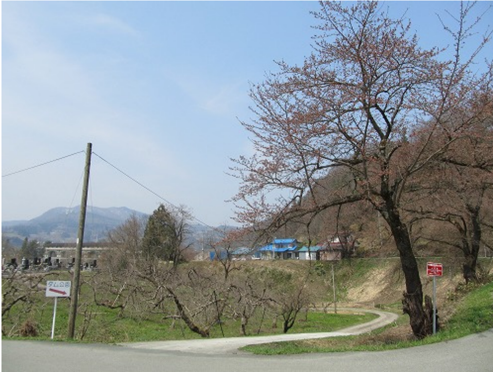
上郷ダムのダム公園入り口