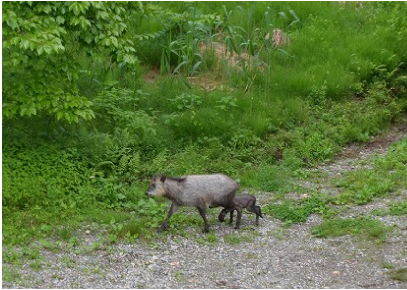
りんご畑の横を歩くカモシカの親子。