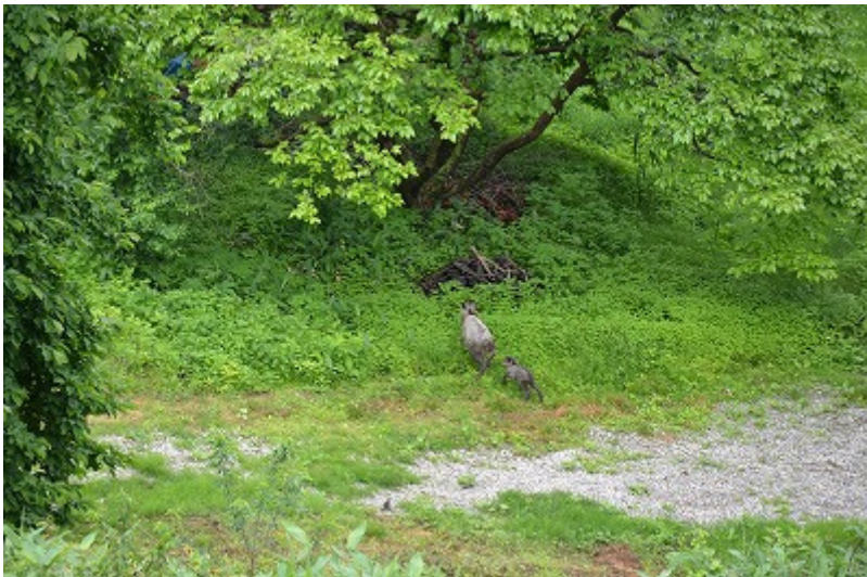
森へ帰っていくカモシカの親子。カモシカは朝日町の町の獣です。