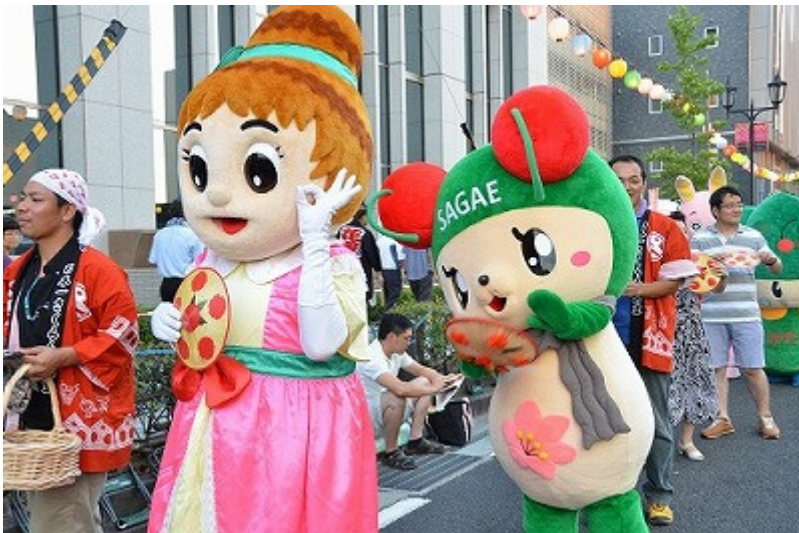
さとみちゃんもバッチリらしい