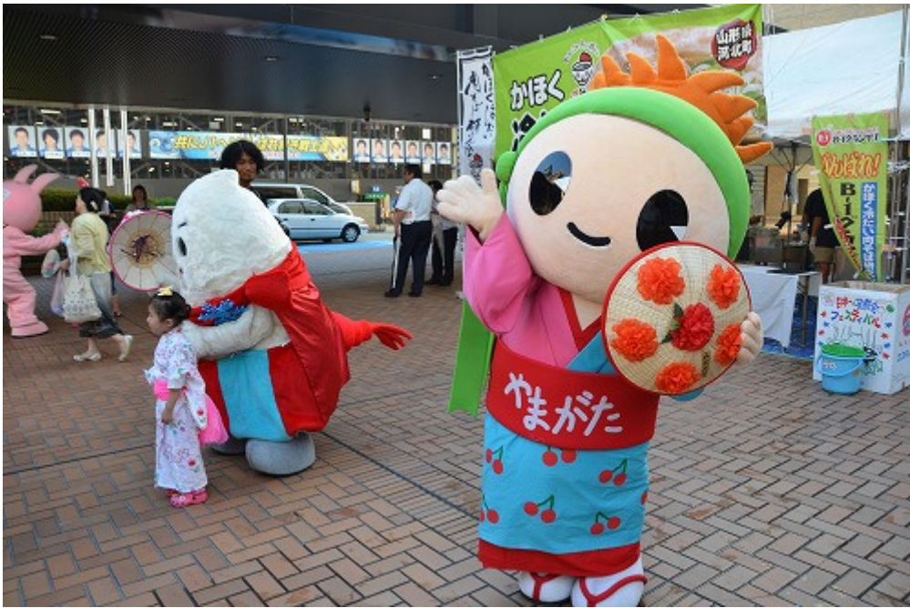
山形市のお宝発見大使「花形ベニちゃん」。