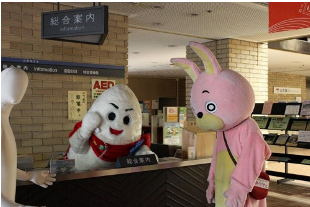
窓口対応もお手の物、蔵王のPRキャラクター「じゅっきー」。