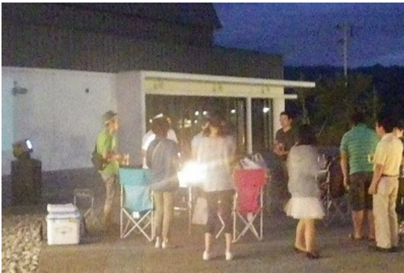
白鷹の若者たちが集結してる