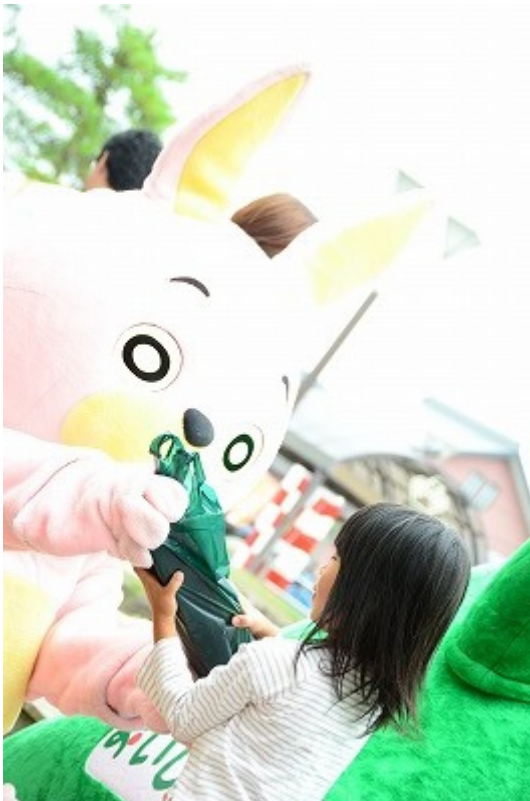
プレゼントを渡すウサビ