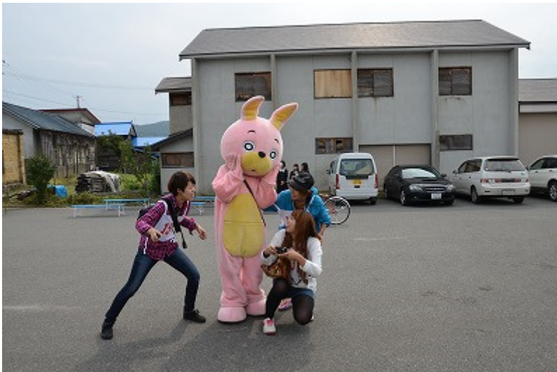
ツアー参加者と触れ合うウサビ