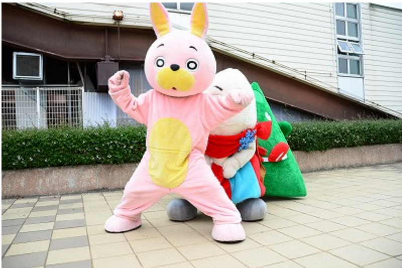
「ときめきをはこぶよ～」