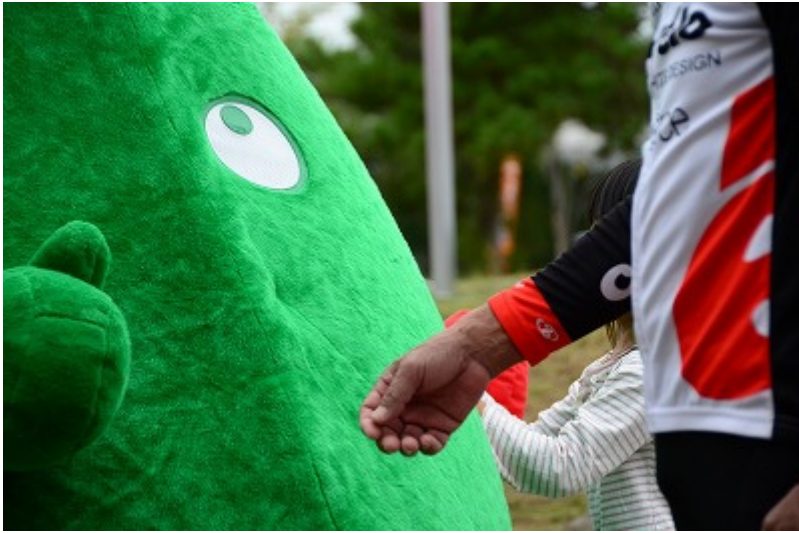
圧倒的な存在感で揺れるペロリン先生