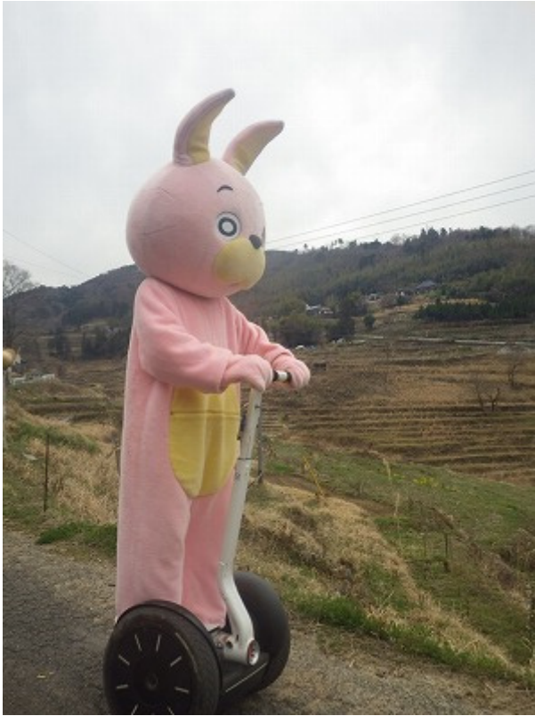
まさかの棚田でハイテクマシンの登場