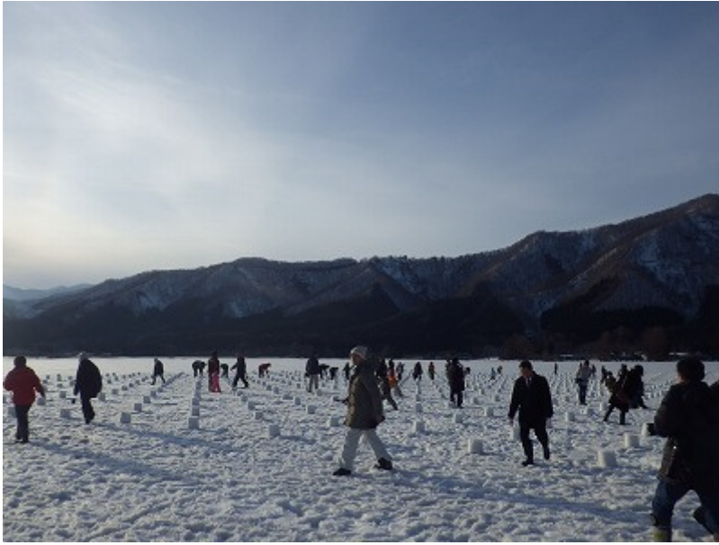
参加者のみんなで作ったスノーランタンは全部で 2000 個