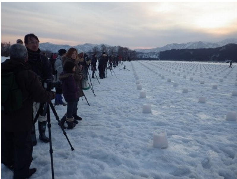
日が暮れるにつれて観客もあつまり……