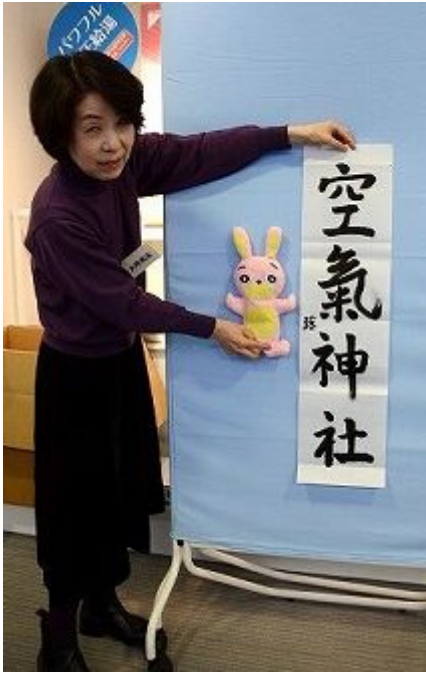
「空気神社」で一件落着。