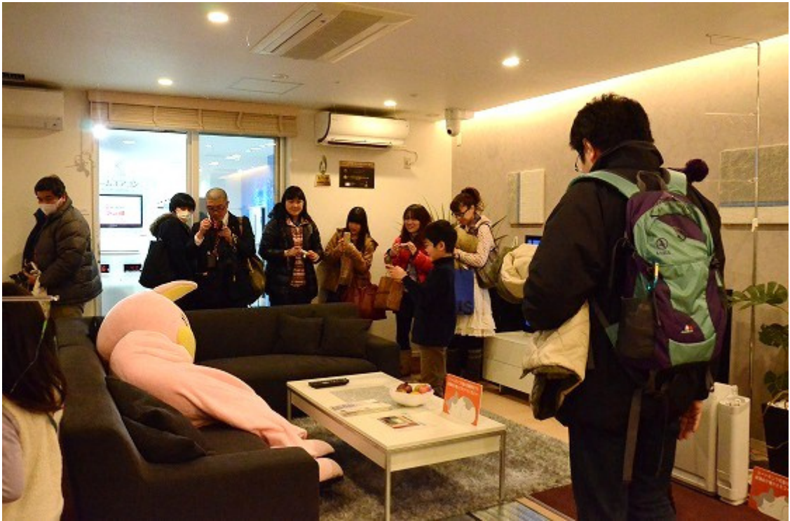
こんな感じや(ダイキンショールーム内モデルルーム)