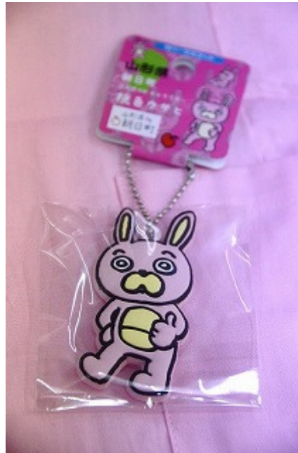
ウサヒラバーマスコット