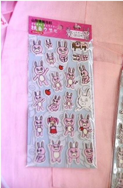
ウサヒぷくぷくシール