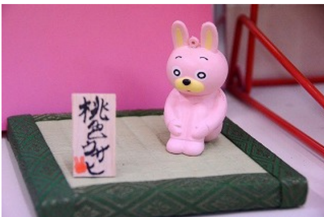
ウサヒぷにぷにマスコット ミニ畳は 町観光協会 で販売中。