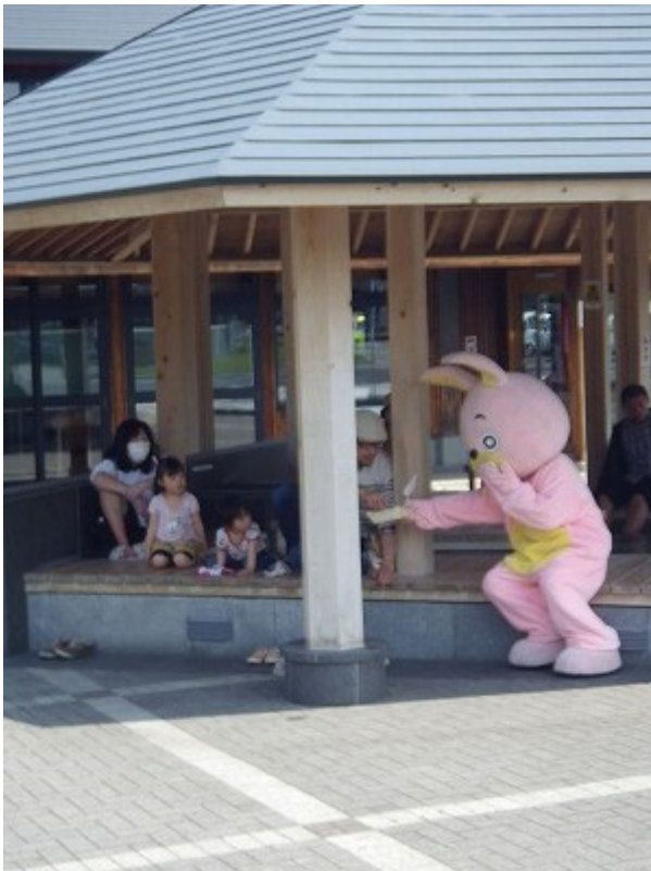
足湯でやすむ人々に、積極的に商品をすすめる