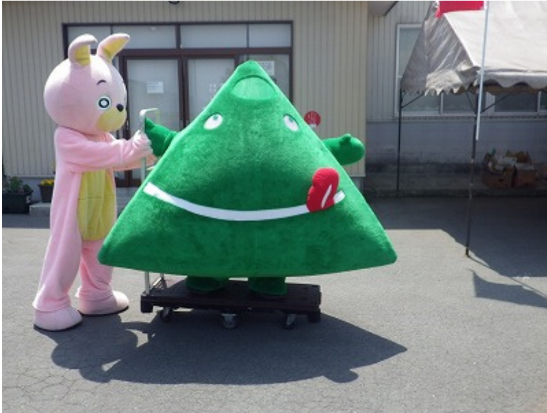
ペロリン先生を台車で移動させるウサビ