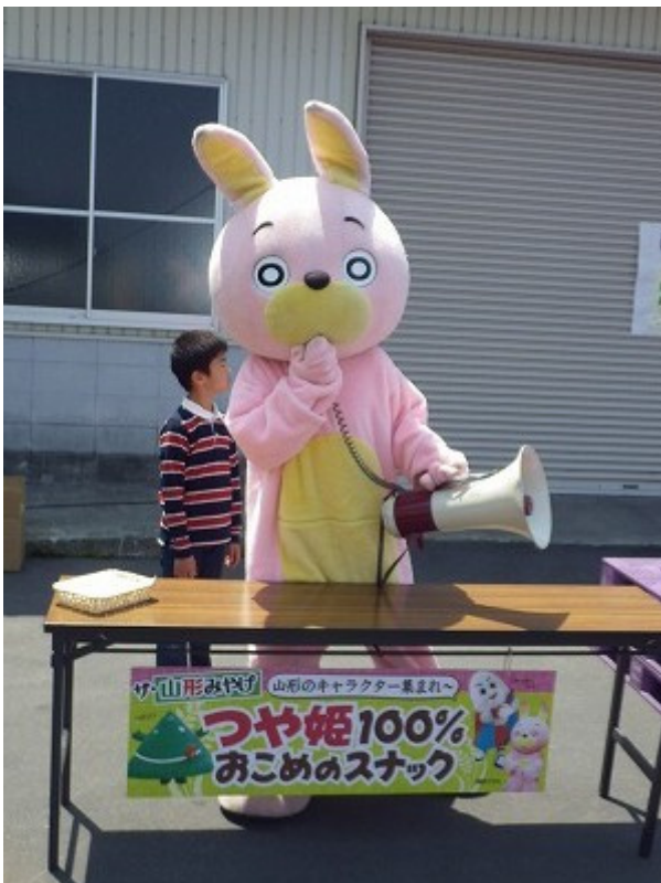
マイクパフォーマンスしたり