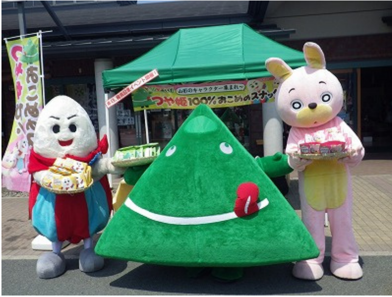
おなじみの3体でお菓子をPR