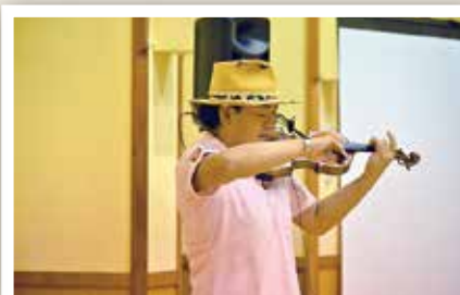
竜馬が朝日町にやってきた!! (8/24)