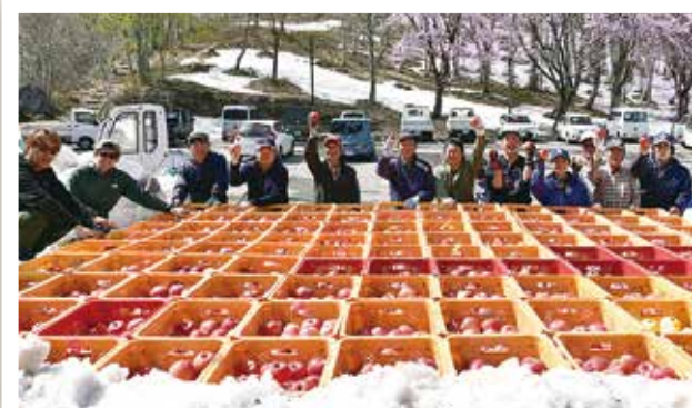
雪りんご掘り出し作業 (4/22) 約 306 箱分のりんごを貯蔵