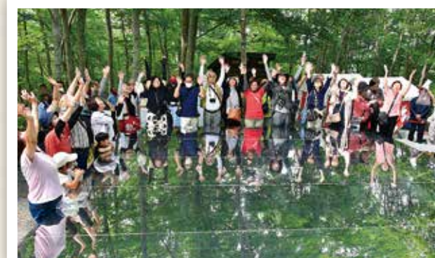
令和 7 年度空気まつり (6/5・6/7 ~ 8) 町内外の来町者が空気の大切さを感じ、楽しむ