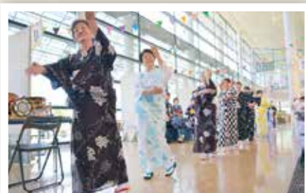
あさひ学びタイト (6/29)