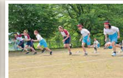
町小学校陸上記録会 (5/21)