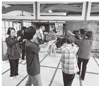
上手に朝日音頭を踊る 大谷第六区の皆さん

日頃、大谷地区区民の方をはじめ朝日町民の方々には大変お世話になり、ありがとうございます。10月から大谷第一・七区で開催している健康教室では、滑舌が良くなる発声