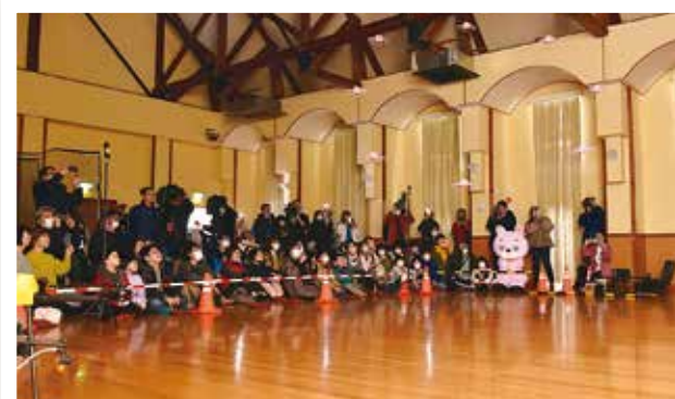
地域おこし協力隊企画のドローンイベント (1/13) 県内初のショーも披露