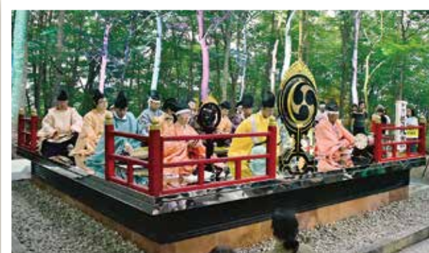
空気神社フォトジェニックライトアップスペシャルデー (7/5) 期間中、1 日限りの特別な日