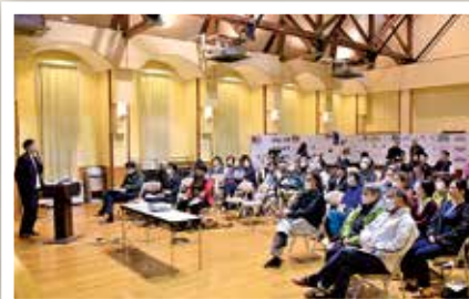
地域おこし協力隊活動報告会 (3/20)