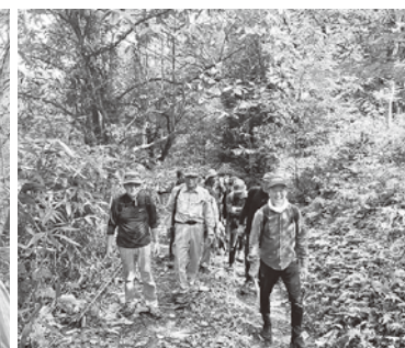
森のトンネルを進む

んご温泉の「のんぽかの森」にて「森林浴と桃源郷の旅」を開催し、大変好評でした(写真は当日の様子)。 朝日町には、豊かな自然、高品質なりんご園、日本初のエコミュージアム、歴史あるナチュラリストクラブなど、世界に誇るコンテンツがたくさんあります。これからは町民の皆さまと力を合わせ、朝日町の発展と豊かな地域づくりに貢献してまいります。