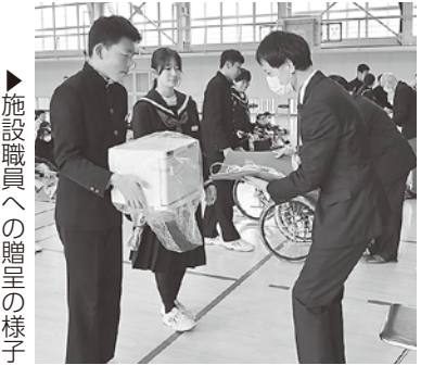
▶施設職員への贈呈の様子

平成26年から朝日中学校の生徒会活動の一環で続く「アルミ缶回収」。地域住民に呼びかけて集めたアルミ缶を資源に、町内の各福祉施設のニーズに応じた介護福祉機器を購入して寄贈するこの取り組みは今回で12回目を数えます。 回収は、アルミ缶を学校に直接持ってきてもらう形で年に2回実施。今年は2130kgものアルミ缶が回収され、12月18日に行われた贈呈式では町内4つの