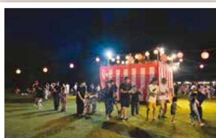
宮宿、大谷で盆踊り開催 (8/14)