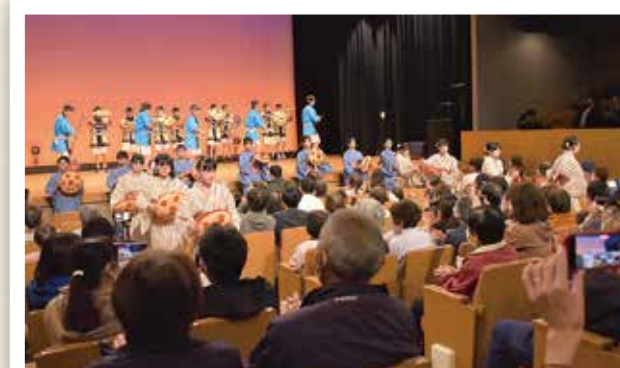
第 61 回 朝日町芸術文化祭 (11/2 ~ 3) 一人ひとりの魅力が生かされた大きなにぎわい