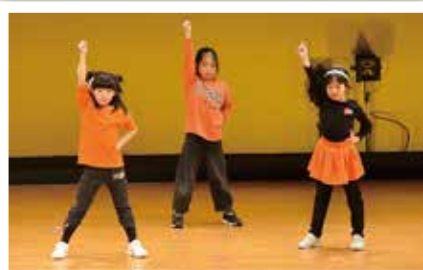
第 37 回 朝日町生涯学習推進大会 (2/23)