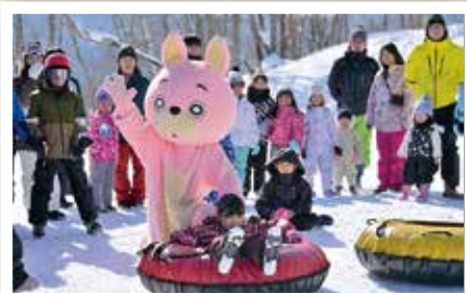
Asahi 自然観スノーパーク スキー場まつり (2/2)