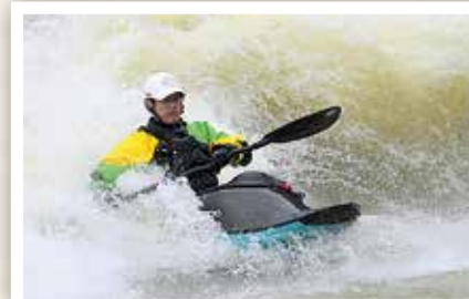
日本カヌーフリースタイル選手権 (4/13)