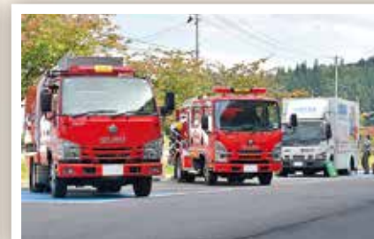
朝日町防災・環境フェア (総合防災訓練) (10/5)