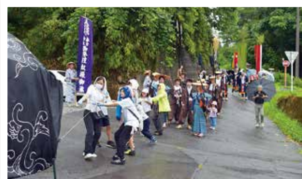
春日神社祭礼 大名行列“お通り” (8/15) 旧暦の閏年にのみ披露される大名行列が 8 年ぶりにお目見え