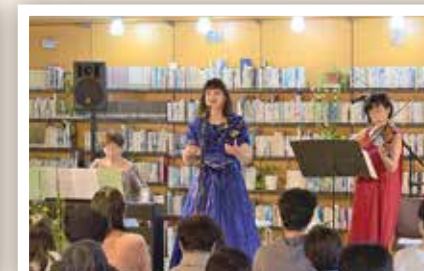
第 10 回 夜の図書館 (12/7)