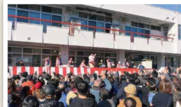
第 46 回 朝日町産業まつり・第 45 回 朝日町りんごまつり (11/22 ~ 23) 町の本気 (マジ) がたくさん詰まった 2 日間