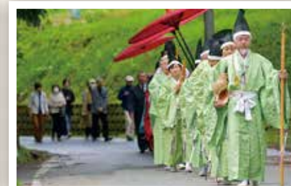
町内各地で祭り開催 (5/3 ~ 5/5)