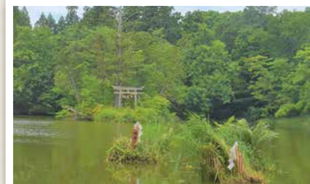
大沼の浮島 国名勝指定 100 周年記念式典 (7/27) 名勝地に指定されてからの大きな節目を祝う