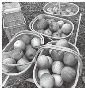
収穫されたりんご (来期は自分の手で栽培を)

今年はおおむね天候に恵まれ、りんごの作業は順調に進んでいました(好天が続き雨が少ない面もありましたが)。しかし、5月頃から肩と首の痛みが続き、受診したところ頸椎のヘルニアとのこと。様子を見ながら作業を続けていましたが、10月初めに症状が悪化し手術を受けました。現在はリハビリ中で、かなりの行動制限を課されてしまい、研修作業も続けられない状況です。周囲の方からは、無理をせずに完治してから再開しようと温かい言葉をいただきましたが、ふがいない気持ちでいっぱいです。 来期は体調を万全にして、頑張っていきたいと考えています。よろしく願っています。