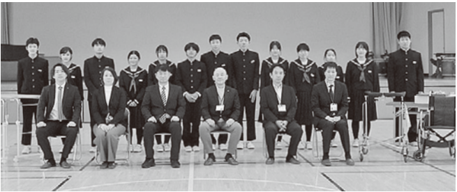
▲生徒会執行部の生徒と各施設職員、 機器を用意した岡崎医療株式会社の社員

平成26年から朝日中学校の生徒会活動の一環で続く「アルミ缶回収」。地域住民に呼びかけて集めたアルミ缶を資源に、町内の各福祉施設のニーズに応じた介護福祉機器を購入して寄贈するこの取り組みは今回で12回目を数えます。 回収は、アルミ缶を学校に直接持ってきてもらう形で年に2回実施。今年は2130kgものアルミ缶が回収され、12月18日に行われた贈呈式では町内4つの