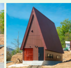
トガッタコテージ