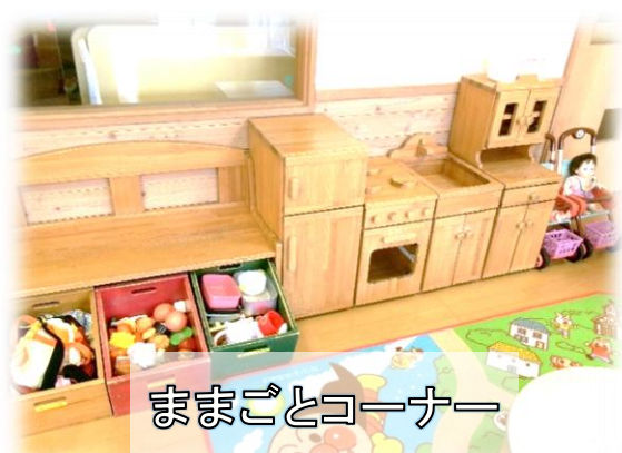
ままごとコーナー

たべものや食器のおもちゃがたくさんあります。 みんなで仲良くおままごと遊びを楽しんでね！