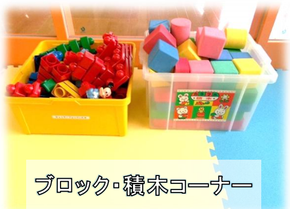
ブロック・積木コーナー