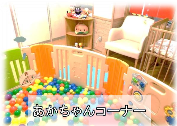
あかちゃんコーナー

広いボールプールでのびのび遊べますよ！棚には、 おもちゃやアンパンマンのぬいぐるみがあります。