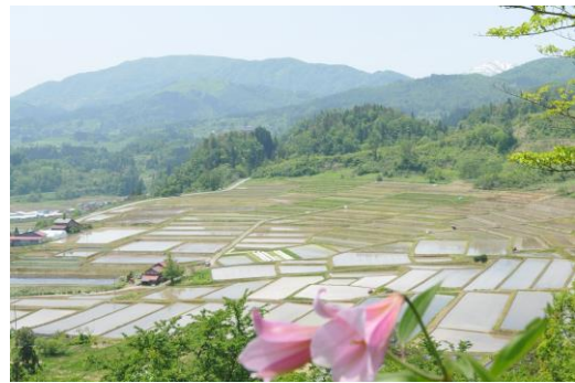
日本の棚田百選「榎平の棚田」