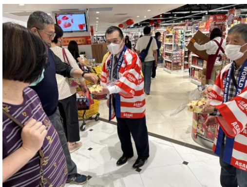
りんごの海外輸出トップセールス