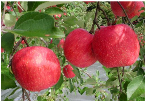
日本一の無袋ふじ

そのようなことから、当町では、町内の農業の維持発展のため、町内生産者のもとで農作物の栽培技術を学び、定住して就農者になることを目指し、また、町農業活性化に尽力することに意欲のある地域おこし協力隊を募集します。