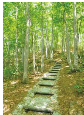
木々に囲まれた参道