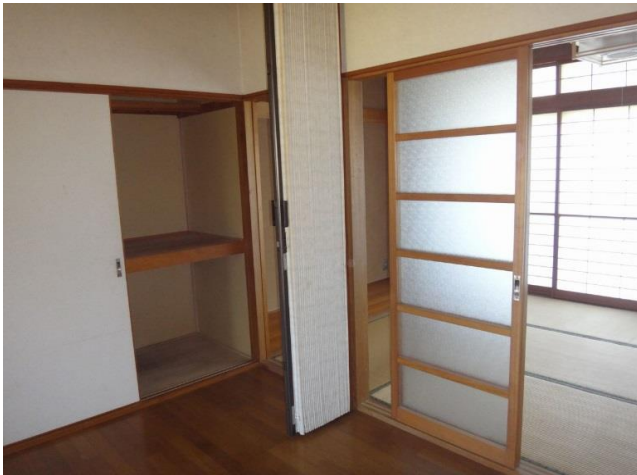
ダイニングと和室